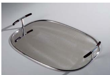
Plateau , 2009 Roland Daraspe Don des Amis de l'hôtel de Lalande, 2009