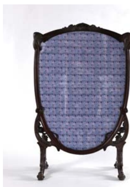
Ecran à feu , vers 1900 Henri Hamm Dépôt du musée des beaux-arts de Bordeaux, 2004