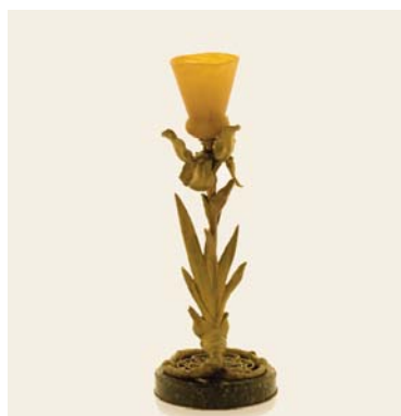
Veilleuse en forme d'iris , vers 1905 R. Heyner - Thiébaud frères Dépôt du musée d'Orsay, donation Rispal, 2010