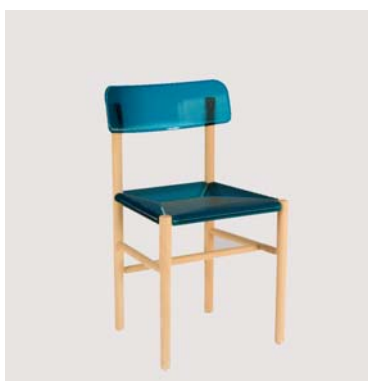
Chaise Trattoria , 2009 Jasper Morrison, éditions Magis, Milan Don Magis, 2010