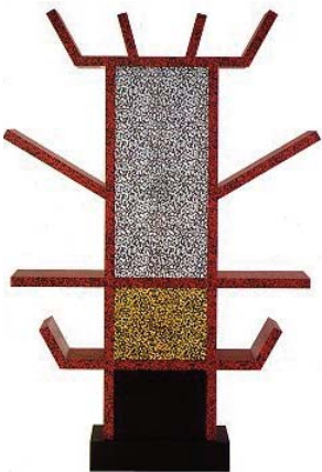
Meuble Casablanca, 1981 Ettore Sottsass, édition Memphis. Don des Amis de l'Hôtel de Lalande, 2005