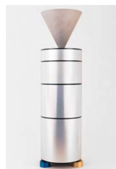
Lampe de table Tétractys , 1985 Sylvain Dubuisson, éditée par Neotu Dépôt du FNAC, 1986