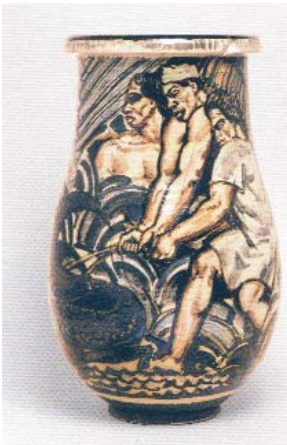
Vase, vers 1931 René Buthaud Achat de la Ville, 1977

After the First World War and the wavy lines of Art Nouveau, a new style, based on simple and geometric shapes appears. Some major Art deco artists were born in Bordeaux or in the area and were promoted by Adrien Marquet, mayor of Bordeaux between the two World Wars, as ceramist René Buthaud, goldsmith Maurice Daurat and painter Jean Dupas. An important furniture made by Maurice Triboy displayed in the two first rooms shows the Bordeaux savoir-faire. The third room is dedicated to René Buthaud, with some major ceramic pieces and a large glass panel, and furnished with pieces coming from the Hôtel Frugès located in central Bordeaux, a luxury mansion fully decorated by Art deco artists. The classical influence subtended this period and is obvious in some works like Bacchus and Arianna by Jean Dupas. In the museum entrance one can notice the sumptuous tin vase made by Maurice Daurat for the 1937 International Exposition which announce the other pieces presented next to René Buthaud's ones, his close friend.