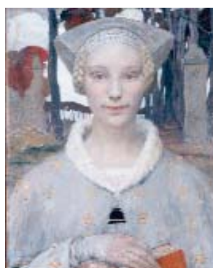
Le Livre de Paix , vers 1900 Edgar Maxence Dépôt du musée des beaux-arts de Bordeaux, 2010