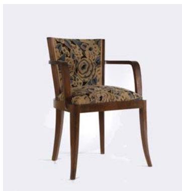
Fauteuil d'un ensemble mobilier, 1930-35 Maurice Triboy Don de M. et Mme Seguin, 1979