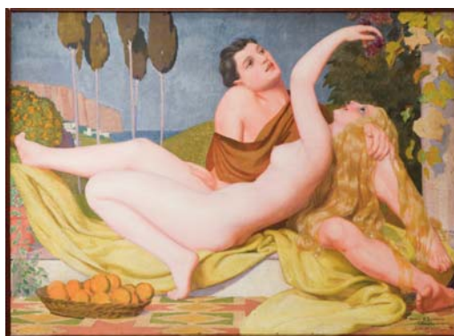
Jean Despujols Bacchus et Ariane, 1925 Dépôt d'un collectionneur privé, 2010