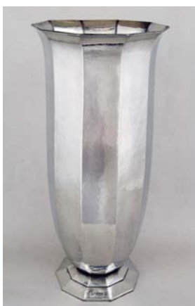
Vase tulipe, vers 1928 Maurice Daurat Don des Amis de l'hôtel de Lalande, 2009