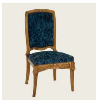
La Berce des prés , 1902 Chaise de chambre à coucher Emile Gallé Dépôt du musée d'Orsay, donation Rispal, 2010