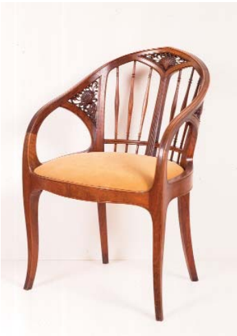
Fauteuil (d'une série de 6) de la salle à manger de l'hôtel Frugès à Bordeaux, 1925 Alexandre Callède Achat de la ville avec subv. du FRAM, 1991