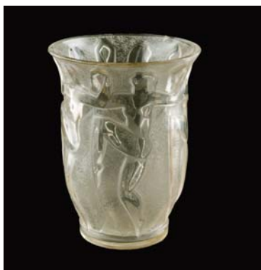
Vase Edouard Cazaux Achat de la Ville, 1981 © Mairie de Bordeaux. Photo L.Gauthier