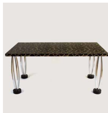
Table City , 1983 Ettore Sottsass, éditions Memphis, Milan Dépôt du FNAC, 2009