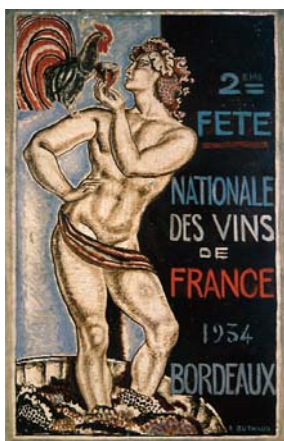
Projet pour la 11 ème Fête nationale des vins de France, 1934 René Buthaud Achat de la Ville, 1986 © Mairie de Bordeaux