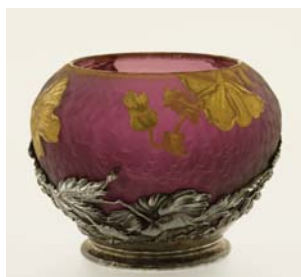
Coupe montée sur argent à décor de coquillots, vers 1896-1900 Cristalleries du Val-Saint-Lambert Dépôt du musée d'Orsay, donation Rispal, 2010