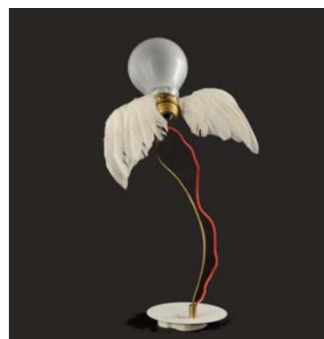
Lampe de table Lucellino , 1992 Ingo Maurer Edition Ingo Maurer GmbH Dépôt du FNAC, 2009