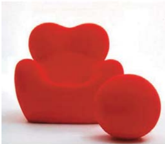
Fauteuil Up 5, Up 6, La Mamma , 1969, Gaetano Pesce, édition B & B Italia, 1969. Dépôt du FNAC, 2009.

Constituée de plus de 200 pièces, la collection du musée, s'est récemment enrichie d'une quarantaine de dépôts du Fonds national d'art Contemporain (Centre national des arts plastiques), du Centre Hospitalier Universitaire de Bordeaux, et a bénéficié de nombreux dons de la société belge Quattro Benelux, de la maison d'édition italienne Magis et de Jasper Morrison. Mettant l'accent sur des pièces historiques témoignant de la diversité des recherches, cette nouvelle présentation, souligne les moments forts ayant marqué l'évolution de la création d'objets et de mobilier au XX ème siècle sur les deux niveaux des anciennes remises à carrosses donnant sur la cour.