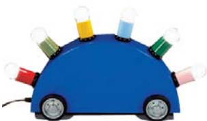
Lampe Super , 1981 Martine Bedin, édition Memphis. Don des Amis de l'Hôtel de Lalande, 2005