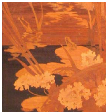
Détail d'une armoire-étagère de salon , vers 1900 Louis Majorelle Dépôt du musée des beaux-arts de Bordeaux, 1992