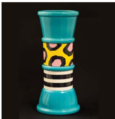
Vase Carrot , 1985 Nathalie Du Pasquier, éditions Memphis, Milan Dépôt du FNAC, 2009