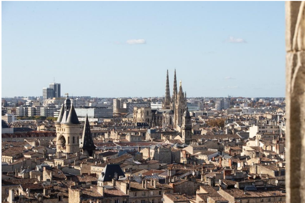
T. Sanson / Ville de Bordeaux